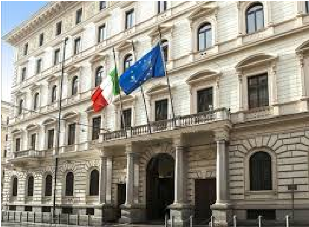
Figura 1: Palazzo Baracchini – sede del Gabinetto del Ministro della Difesa