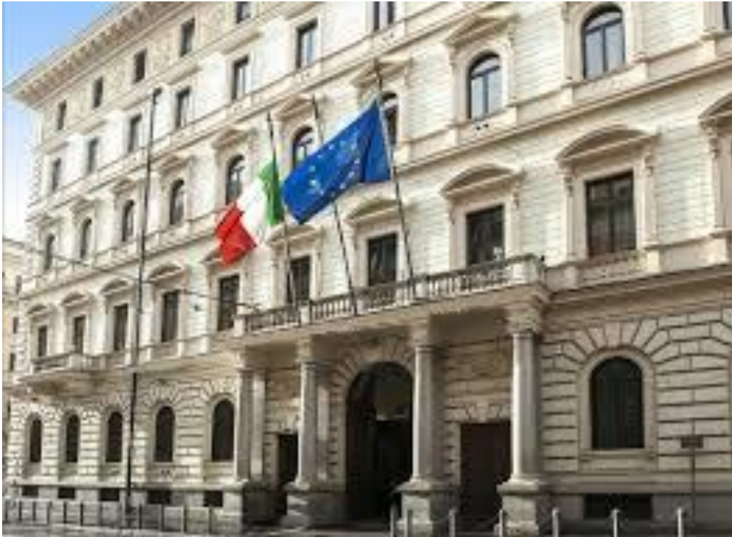
Figura 1: Palazzo Baracchini – sede del Gabinetto del Ministro della Difesa