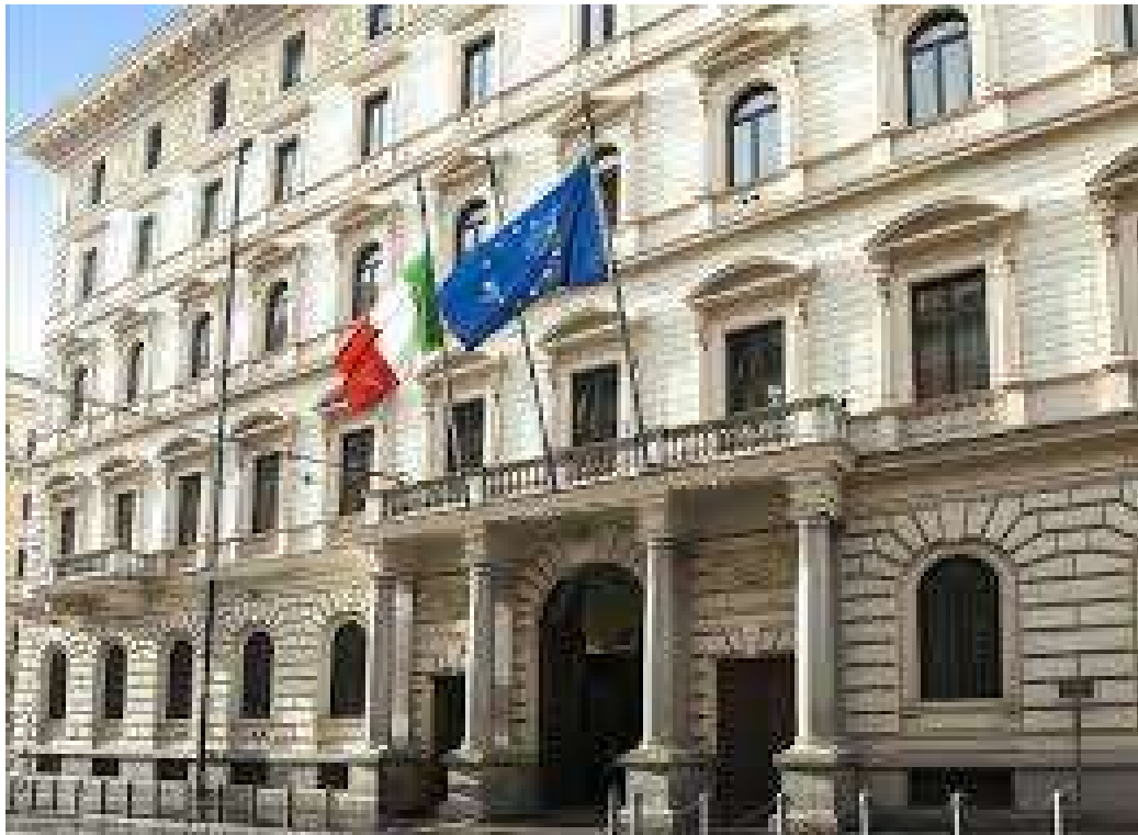
Figura 1: Palazzo Baracchini – sede del Gabinetto del Ministro della Difesa